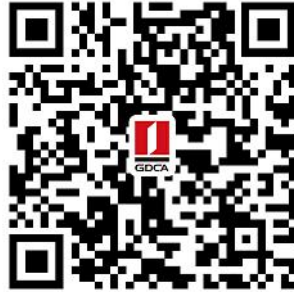
江门市公共资源交易平台 数字证书业务申请二维码