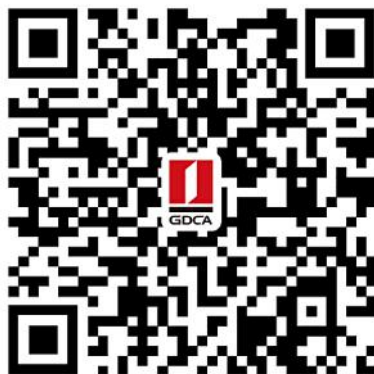
江门市公共资源交易 (土地自然人证书) 数字证书业务申请二维码